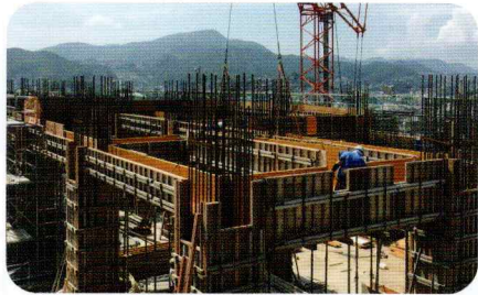
2020年7月 3階鉄筋・型枠工事