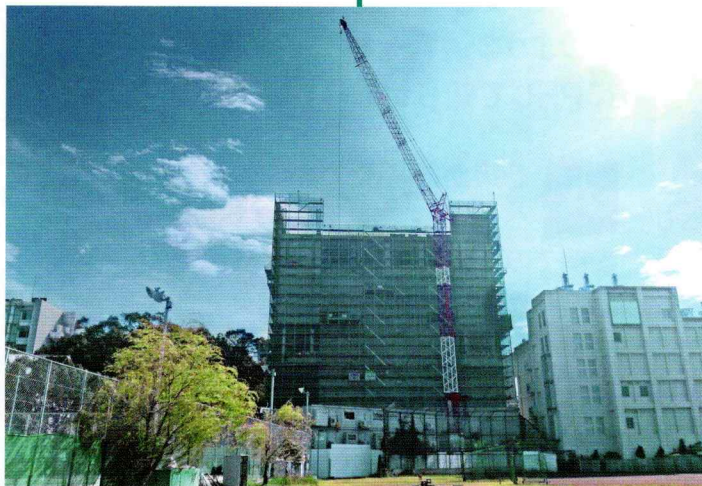
2020年10月 屋上階 鉄筋・型枠工事