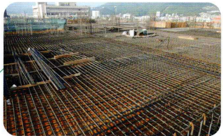
2020年8月 4階鉄筋・型枠工事