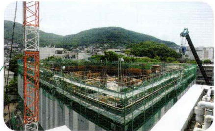
2020年5月 2階鉄筋・型枠工事